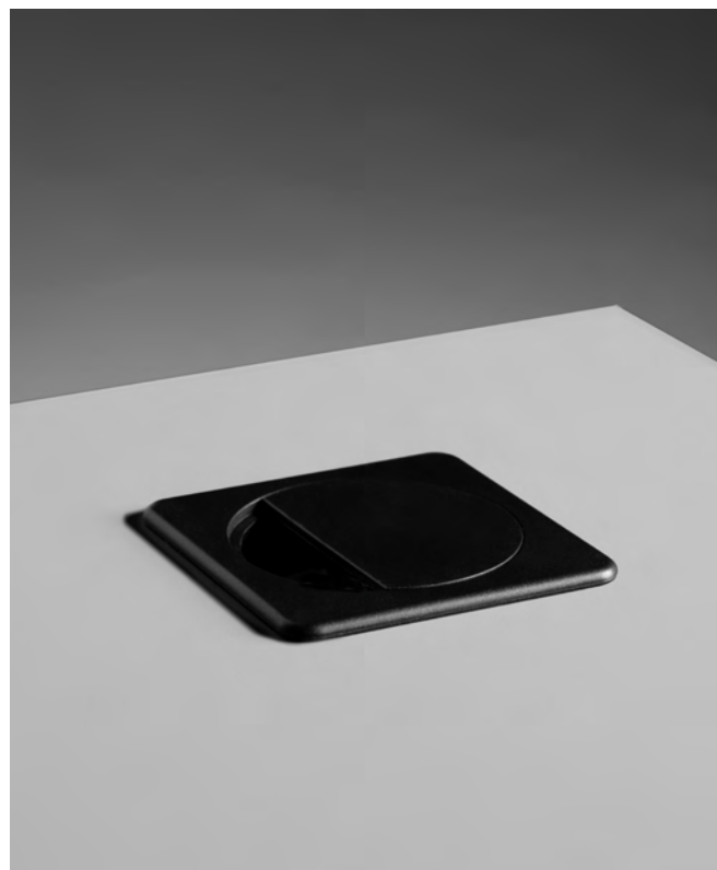
Grommets and media ports

Plateau réalisé en panneau de particules mélaminé double face (PPSM) avec chant 2 mm