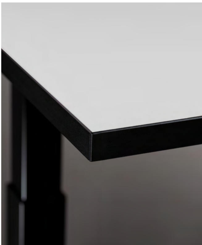
Table top made of melamine faced chipboard (MFC), with 2mm edge

Plateau réalisé en panneau de particules mélaminé double face (PPSM) avec chant 2 mm